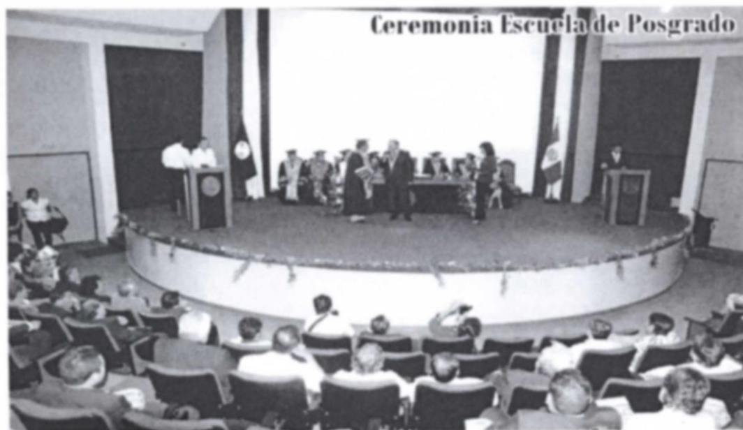
AULAS DE LA ESCUELA DE POSGRADO