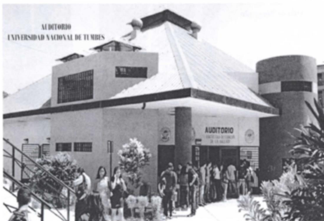
ESCENARIO DONDE SE REALIZAN LAS ACTIVIDADES PROTOCOLARES DE LA UNIVERSIDAD NACIONAL DE TUMBES